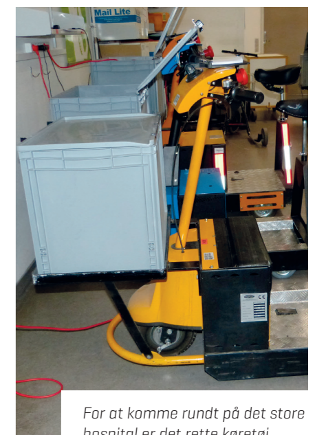
For at komme rundt på det store hospital er det rette køretøj nødvendigt.