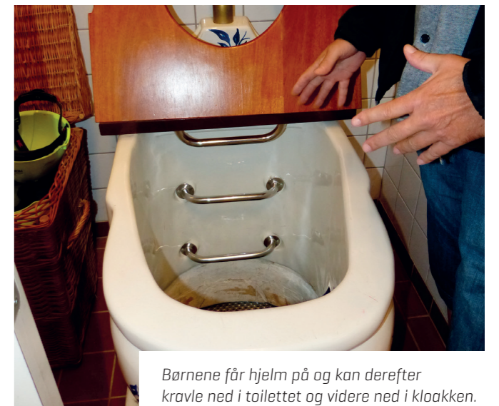
Børnene får hjelm på og kan derefter kravle ned i toiletet og videre ned i kloakken.

Flere gange årligt holder Energi og Vand gratis Åbent-Hus arrangementer for alle.