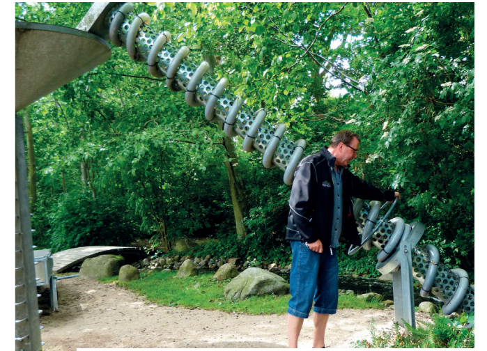
Der er mange sjove maskiner hos Energi og Vand, som børnene dårligt kan vente med at prøve. Denne her stårovre ved den lille kunstige flod.