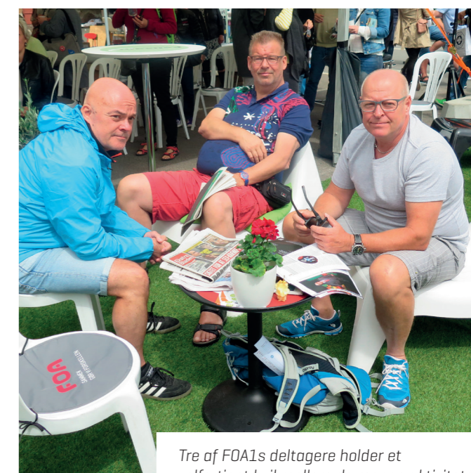
Tre af FOA1s deltagere holder et velfortjent hvil mellem de mange aktiviteter.

En livlig debat om velfærd, effektiviseringer, politisk mod, ressourcer, pressede medarbejdere og nye løsninger fyldte hurtigt tiden, og alt tyder på, at kommunalvalgkampen bliver spændende at følge rundt omkring i kommunerne.