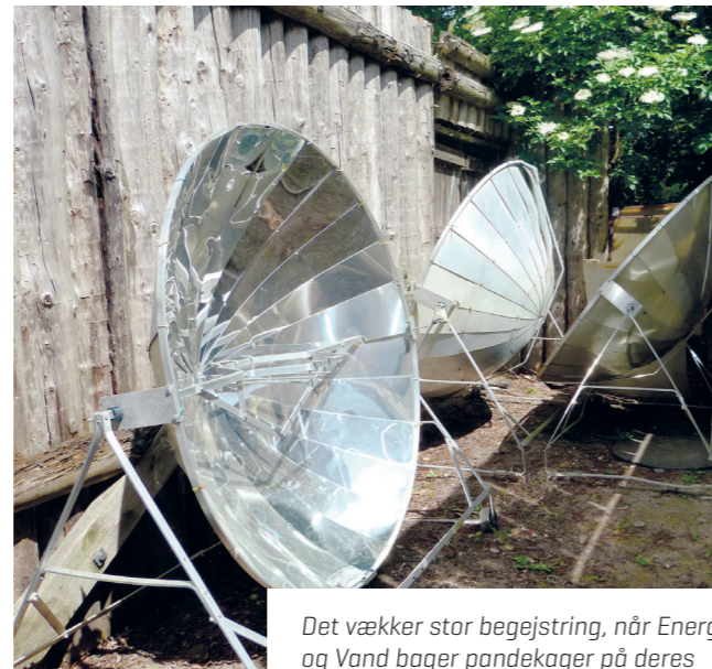
Det vækker stor begejstring, når Energi og Vand bager pandekager på deres solenergimaskiner