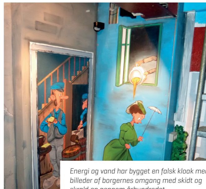
Energi og vand har bygget en falsk kloak med billeder af borgernes omgang med skidt og skrald op gennem århundredet.